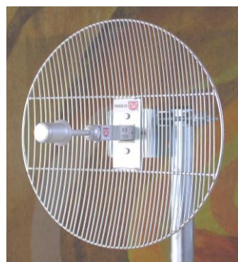
Obr.3 Správne nastavenie žiariča

Zasuňte skompletovaný žiarič antény tak, aby bola ryška, zobrazená na nálepke, súbežne s hranou držiaka.