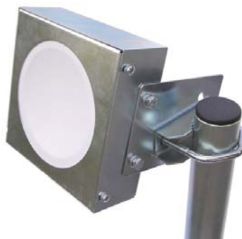
využitie Z3D-V pre úchyt tieniaceho krytu CSAT