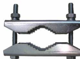
dvojica žralokov 2Z1