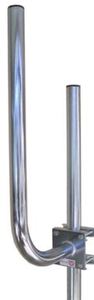
KS1-60 + 2x ZZ1