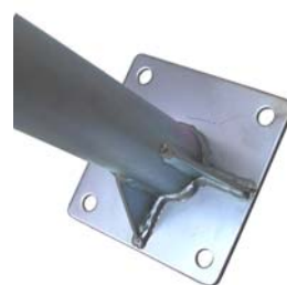
príruba KS2 (KS1-60)