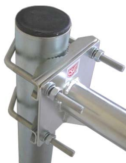
detail úchyty KS