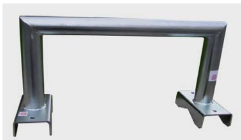
KB320EX s prírubami „ výsek V „

Príruby KB320EX môžu byť na objednávku vyrobená s výsekom „ V „