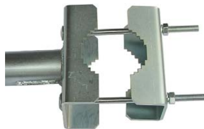
príruba KB320EX + Z14 + prísl.

Za príplatok je možné objednať KB320EX s povrchovou úpravou žiarový zinok ( MAZ ), pre úpravu MAZ sa poskytuje záruka 5 rokov.