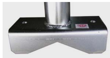
príruba KB320EX s výsekom „ V „