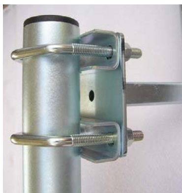
príruba KML300T + 2xVBZ3

Za príplatok je možné objednať KML300T s povrchovou úpravou žiarový zinok ( MAZ ), označenie v názve KML300T MAZ , pre úpravu MAZ sa poskytuje záruka 5 rokov.