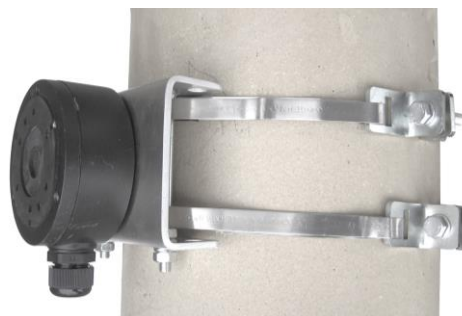
montáž na stĺp – použitie pásky Bandimex a úchytiak KPRU16 TWIN