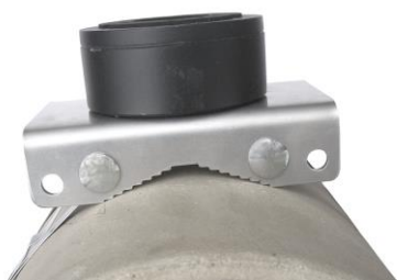
UK105 + DS-1280ZJ-XS montáž na stĺp